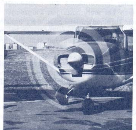
Propeller mit Sicherheitsbemalung