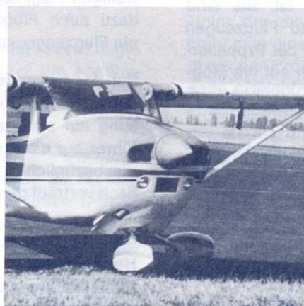
Propeller ohne Sicherheitsbemalung