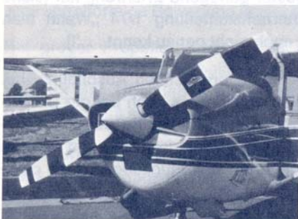
Die Bemalung des Propellers nach dieser Empfehlung